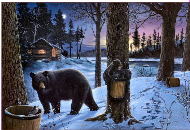
Коллекция сюжетных картин «Звери». Март. Заповедник.